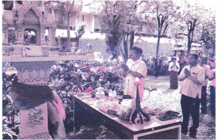
ทำบุญครบรอบ 39 ปี การก่อตั้ง สหกรณ์ออมทรัพย์สาธารณสุขเชียงใหม่ จำกัด เมื่อวันที่ 3 มิถุนายน 2559